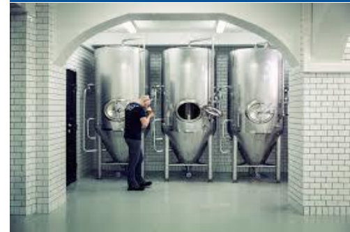
Abbildung: Macks Mikrobrauerei